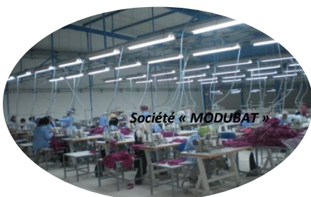
Groupe « ZANNIER »