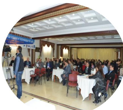
Colloque « Energies renouvelables »